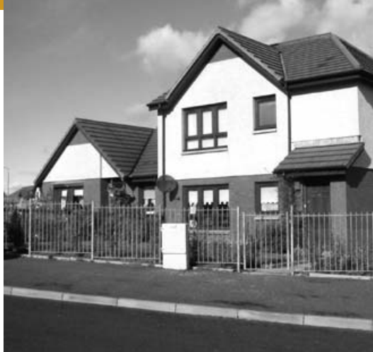
À gauche : Lochfield Park, une des coopératives d'habitation visitées pendant une tournée des coopératives d'habitation du Royaume-Uni à l'automne 2003. Ci-dessous : un représentant de l'habitation en Afrique du Sud cause avec le personnel de la FHCC pendant une visite à Vancouver (C.-B.).