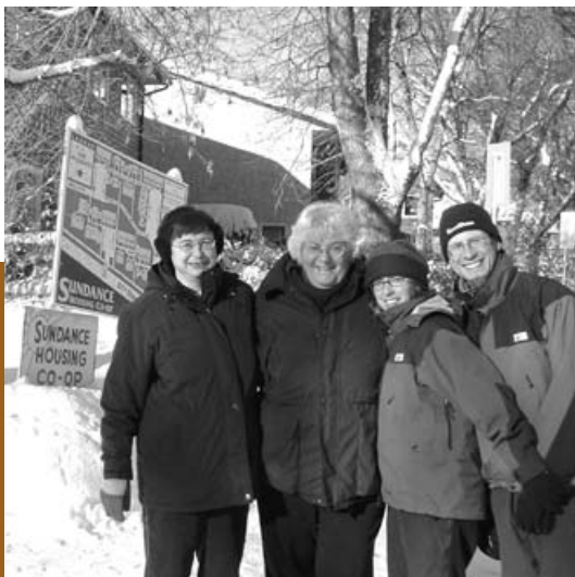
Ci-contre, en haut : De jeunes membres de la Jasmine Place Housing Co-op de Vancouver (C.-B.) observent le début des travaux de réparation des coopératives aux prises avec des problèmes d'infiltration d'eau. À gauche : La Sundance Housing Co-op d'Edmonton (Alberta) célèbre un nouveau financement pour la construction de logement pour les aîné(e)s. Ci-dessous : La Landview Housing Co-op de New Glasgow (N.-É.).

À la fin de 2003, nous étions tout près de notre objectif de création d'une agence indépendante chargée de l'administration des programmes fédéraux d'habitation coopérative. Mais nous avons été frustrés de ne pas pouvoir obtenir un protocole d'entente et un premier contrat avec le gouvernement du Canada. Nous avons des discussions détaillées en vue de la création de l'agence avec la Société canadienne d'hypothèques et de logement depuis la fin de 2002, c'est-à-dire depuis que le ministre responsable de la SCHL a donné un feu vert conditionnel à l'agence.