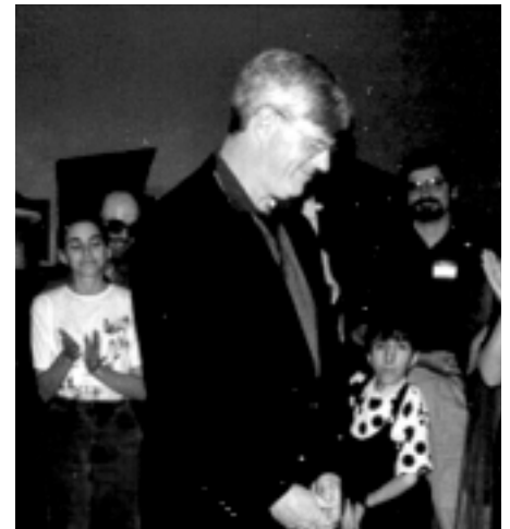
Le ministre des Finances John Manley

L a bonne nouvelle est que le budget fédéral du 18 février prévoit une aide financière pour le logement. Le ministre des Finances John Manley a annoncé une aide financière additionnelle pour l'initiative de logement abordable annoncée en 2001, un financement renouvelé pour le Programme d'aide à la remise en état des logements et le maintien du financement pour les initiatives fédérales visant à venir en aide aux sans-abri.