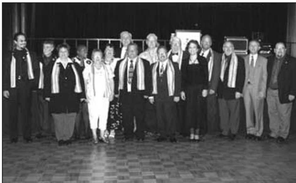
Le Conseil d'administration de la FHCC pour 2004-2005